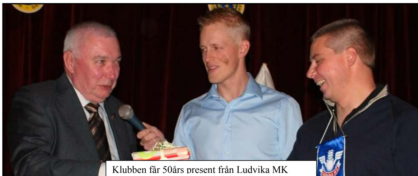
Klubben får 50års present från Ludvika MK